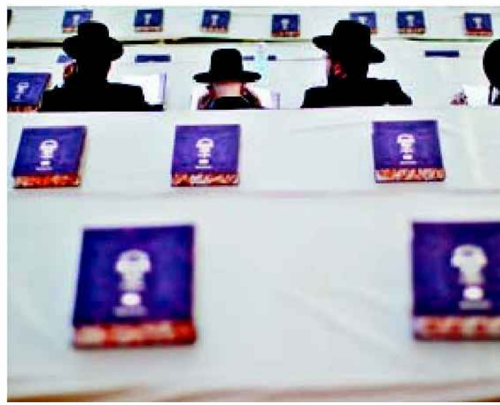
תלמידי ישיבה קוראים בתלמוד. בורות לא הייתה אופציה