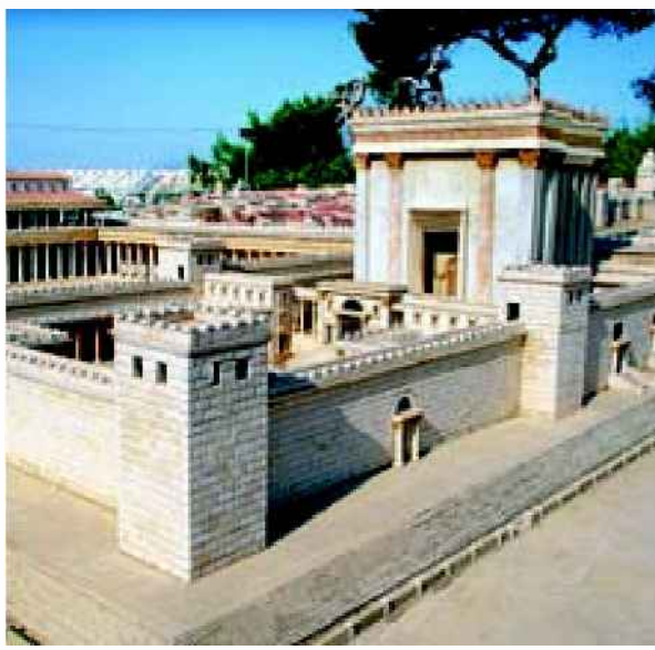
דגם של בית המקדש השני. מדת פולחן לדת הסוגדת לטקסט